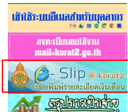
รูปที่ 2 เลือกจากแบนเนอร์